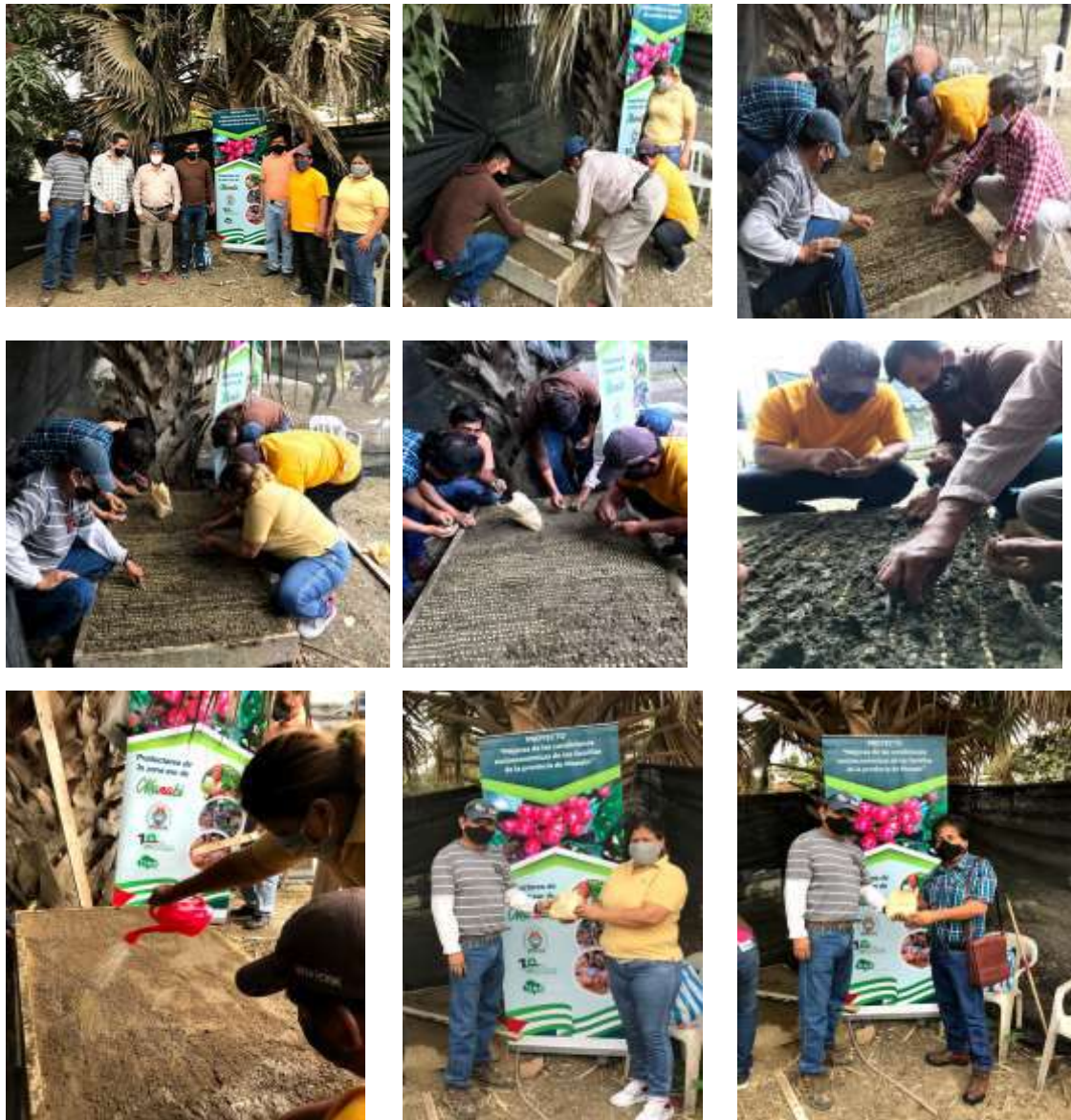
Capacitación en construcción de semilleros de café, sitio Cabo de Hacha.

En el cuadro 3, se presenta la nómina de beneficiarios que recibieron semilla de café por parte del proyecto, la misma que ha sido utilizada para la construcción de los semilleros correspondientes que forman parte de la fase II del proyecto “Mejoras de las condiciones socioeconómicas de las familias de la provincia de Manabí”,