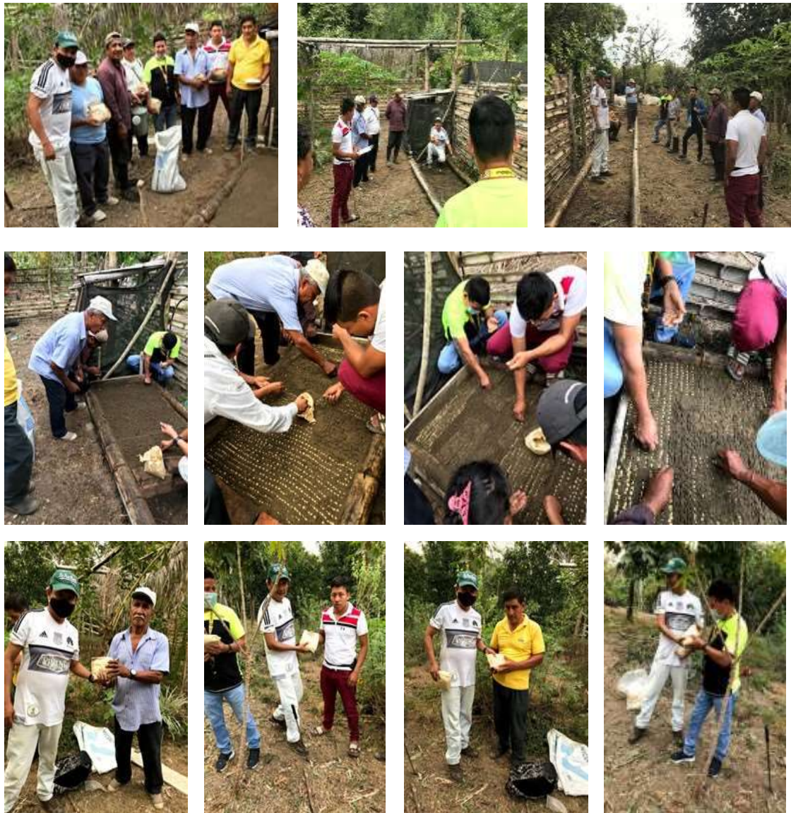
Construcción de semilleros y entrega de semillas de café arábigo en el sitio Ramo Grande