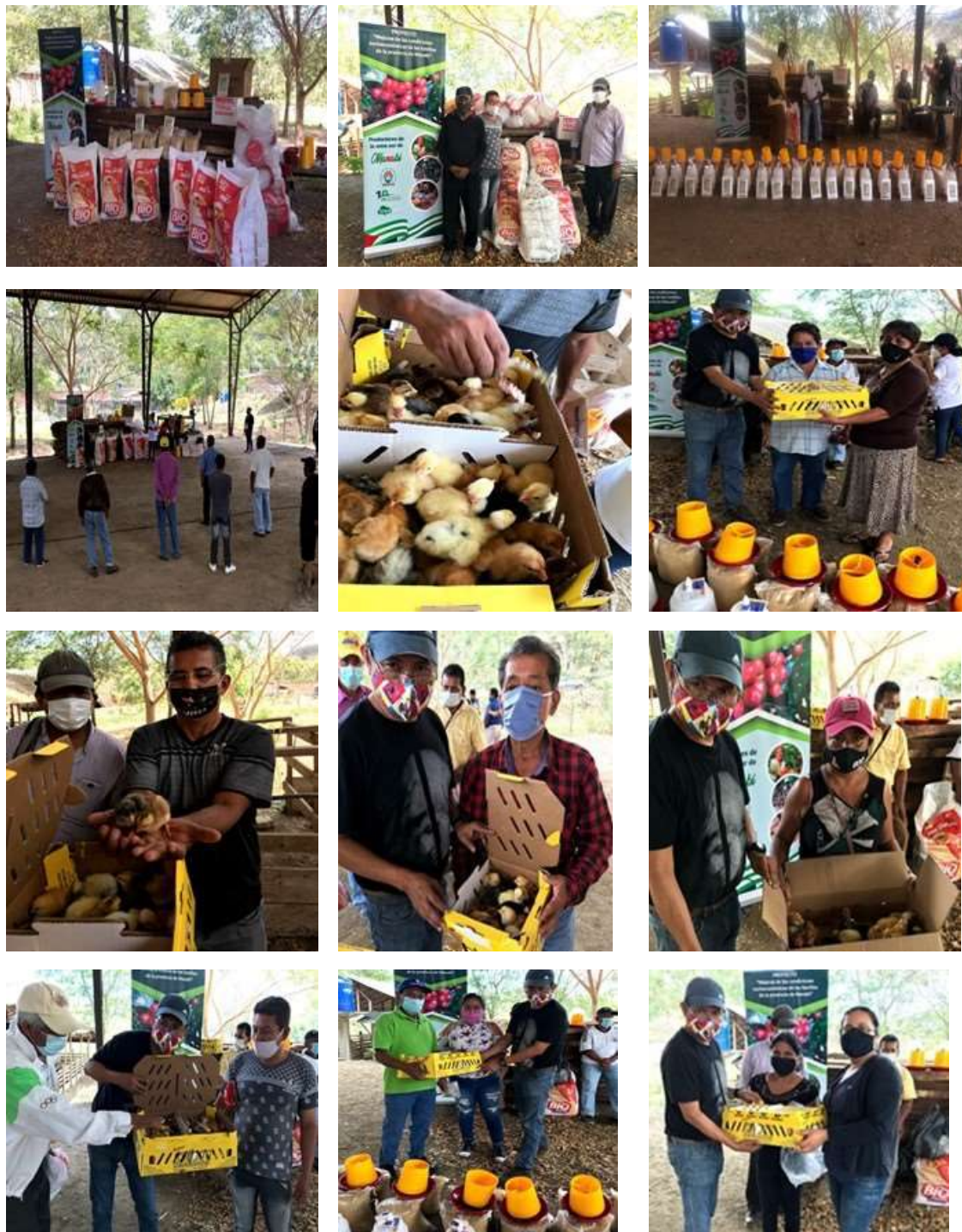
Figura 3. Entrega de kit avícola para la seguridad alimentaria