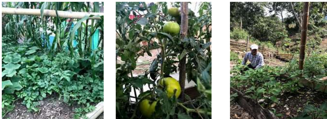
Figura 3. Huertos familiares contruidos por las familias vinculadas al proyecto

En esta perspectiva de garantizar la seguridad alimentaria se viene impulsando el establecimiento de huertos familiares y la cría de pollos camperos en cada familia vinculado al proyecto. Para dicho propósito el 25 de julio/2020 se realizó la entrega de 34 combos hortícolas, cada uno conformados por semillas de tomate, pimiento, sandía, melón, cilantro, cebolla colorada; los que están siendo utilizados para la producción de pequeños huertos familiares para el autoconsumo.