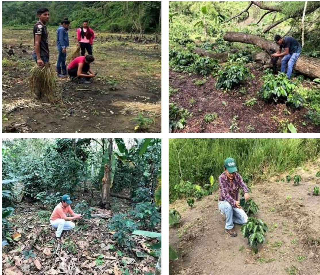
Figura 1. Actividades de georreferenciación de plantas