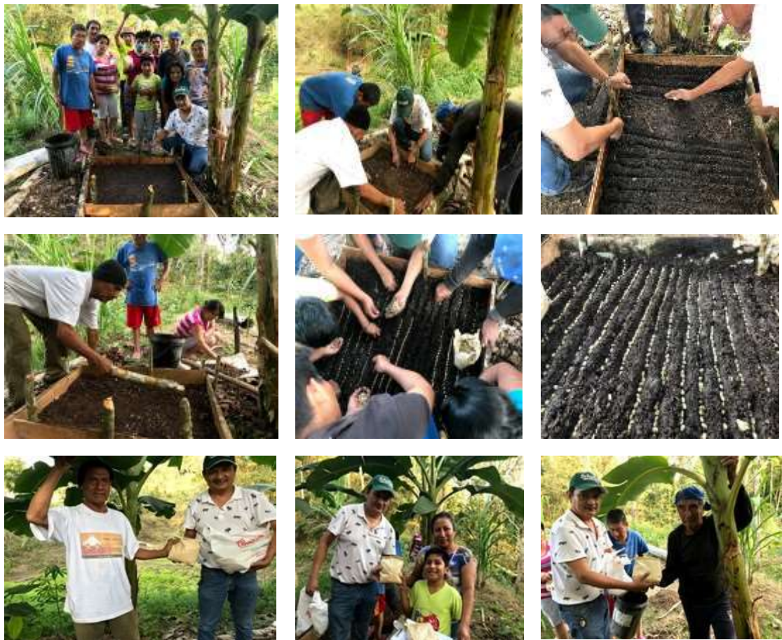
Construcción de semilleros y entrega de semillas de café arábigo en el sitio San Francisco

En cada equipo de trabajo, por motivos logísticos se acordó realizar viveros grupales, asociando entre 3 y 5 beneficiarios en un solo semillero, al momento se tiene construidos alrededor de 10 semilleros.