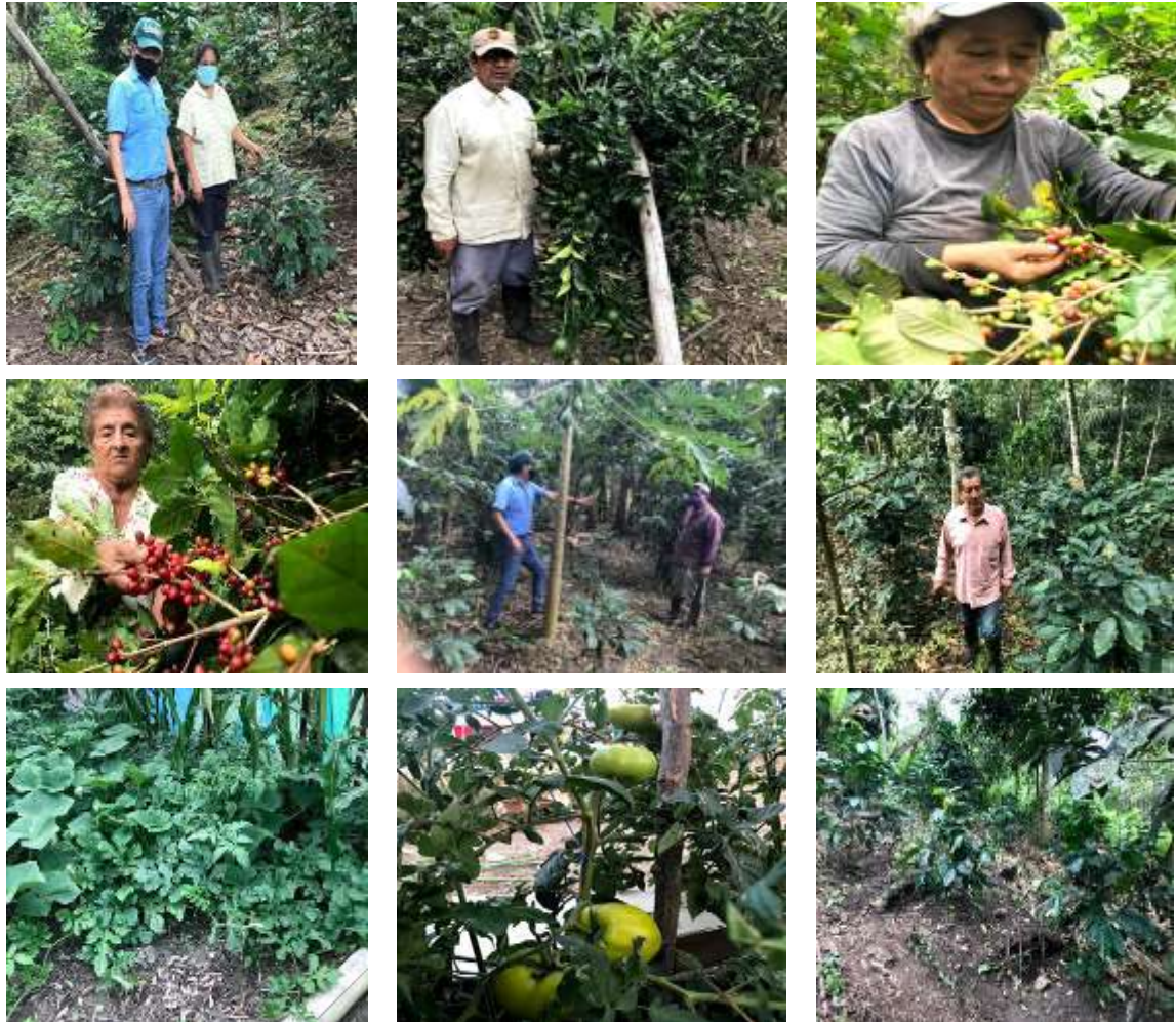
Figura 4. Asesoramiento en manejo sostenible de las unidades de producción.

Además, se viene verificando la construcción de huertos familiares y la crianza de los pollos bb entregados como incentivos en el proyecto.